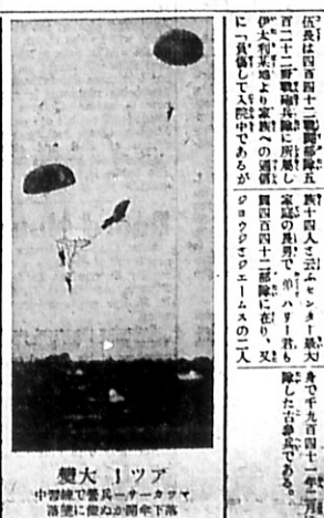
大ツア 中野に能く一ツア 中野に能く一ツア