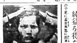
少捕房 慶六十年少捕房