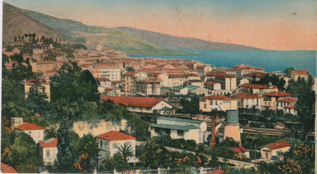
1433. - MENTON. — Vue générale. R. M. General view.