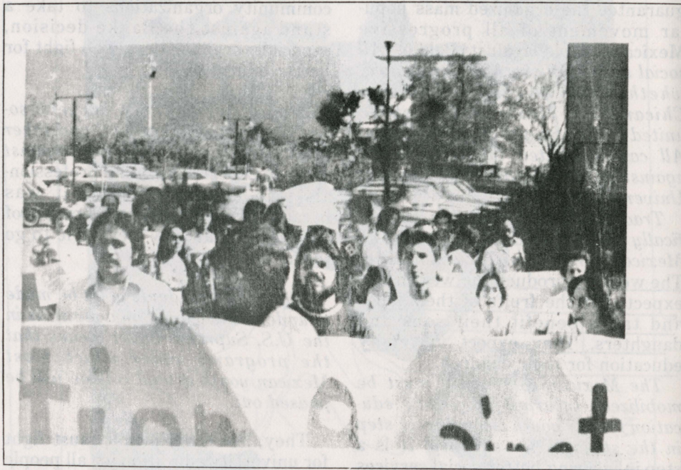
Reprinted from SIN FRONTERAS, Vol. 3 No. 6, Los Angeles, California

WORKERS OF ALL NATIONALITIES HAVE A RIGHT TO AN EDUCATION