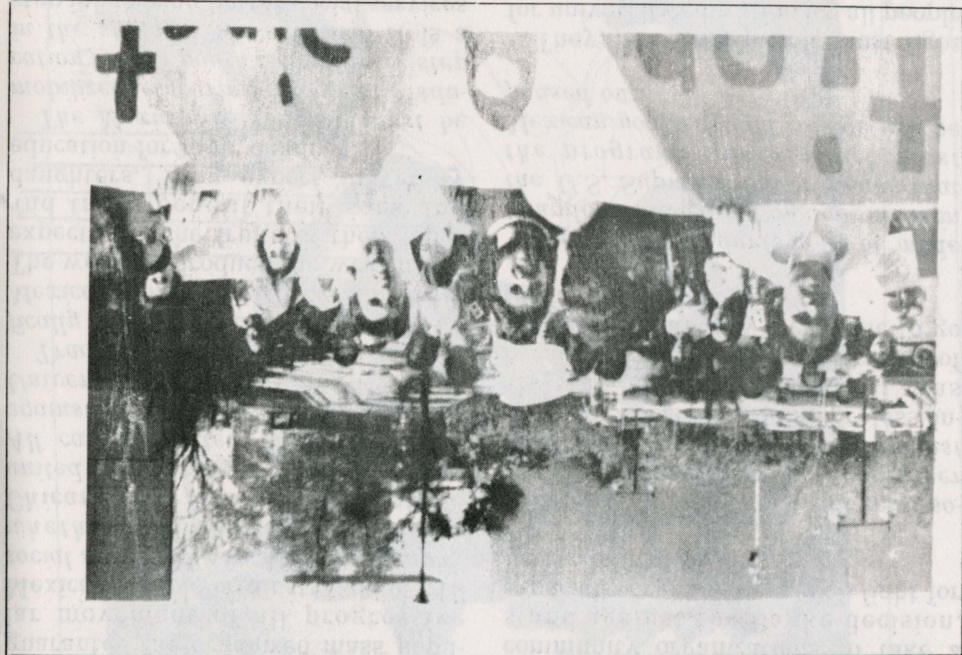
Reprinted from SIN FRONTERAS, Vol. 3 No. 6, Los Angeles, California

WORKERS OF ALL NATIONALITIES HAVE A RIGHT TO AN EDUCATION