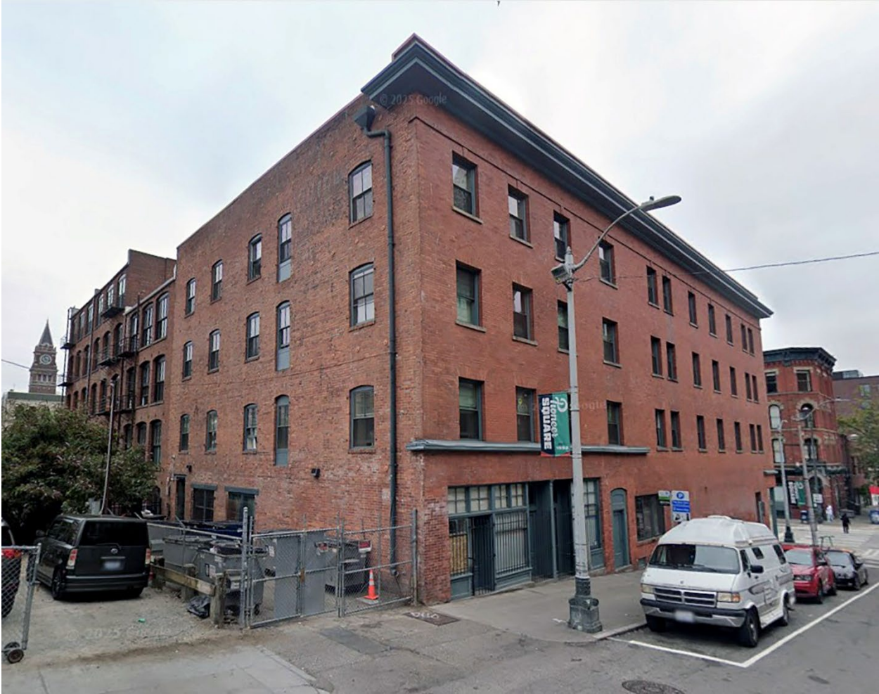
Here is a 2025 view of the 309 – 301 South Washington Street building: